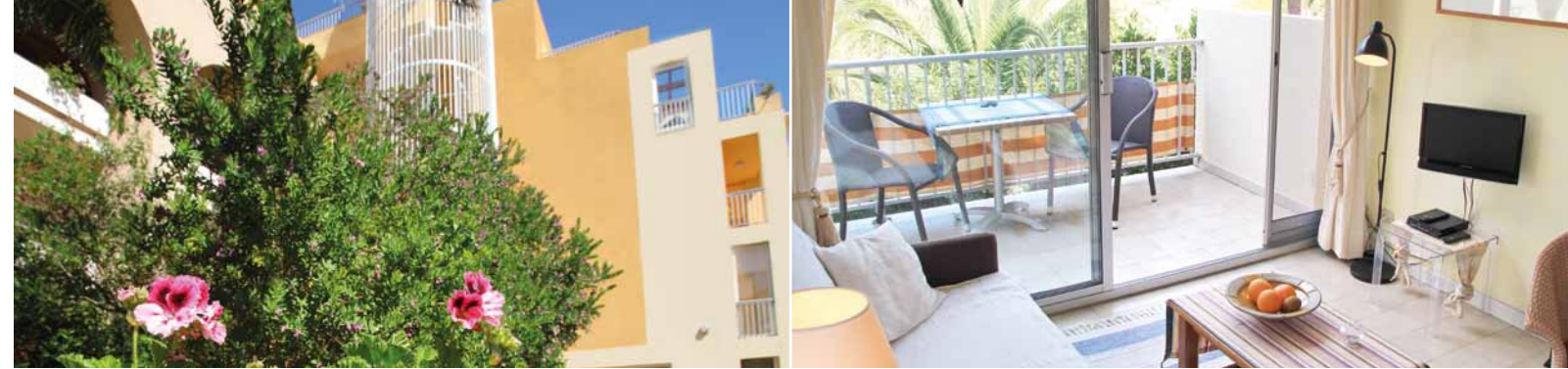
Les Résidences Pinéa – Wohnbeispiele

Alle Angebote sind miteinander kombinierbar.